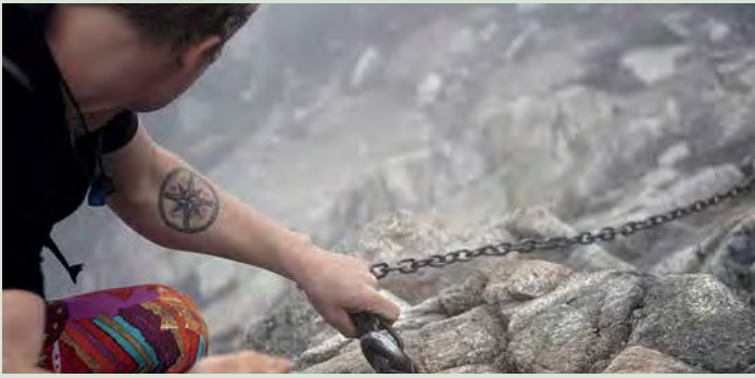
Das Abenteuer fängt oft da an, wo der Komfortbereich aufhört – hast du es so gewollt? Stefanus Stahl

Die Definitionen verbinden aber auch die Begriffe Abenteuer und Wildnis miteinander: Wer sich in eine von Menschen weitestgehend unberührte Natur (= die Wildnis) begibt, der erlebt Abenteuer, weil er seine gewohnte Umgebung verlässt. Die horoskopartige Formulierung ist genau der Punkt: Wer seine gewohnte Umgebung verlassen will, der muss nicht weit reisen. Die gewohnte Umgebung ist nichts mehr als – die Gewohnheit. Einmal links statt rechts abbiegen genügt, um sie zu verlassen. Eine Tour mit einem anderen Sportgerät oder zu einer anderen Tages- oder Jahreszeit begehen reicht für unzählige Abenteuer in der Wildnis aus – sagt unser Gefühl genauso wie die Definition.