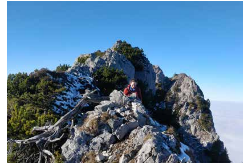
Am Zwölf-Apostel-Grat: Das könnte Jugendleiterin Maria sein.

Nach einigen weiteren Stunden Tour und ein paar Schwierigkeiten beim Abklettern hat die Gruppe es dann geschafft: Alle sind wohlbehalten auf dem Forstweg angekommen und schlendern nun gemütlich ins